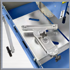
butée d'angle réglable