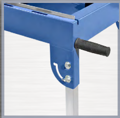
pieds de table escamotables