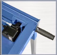
fixation de la pompe à eau