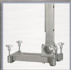
4 vis pour un carottage précis