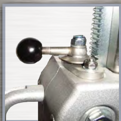
Vis de blocage du chariot