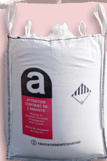
BIG BAG AMIANTE