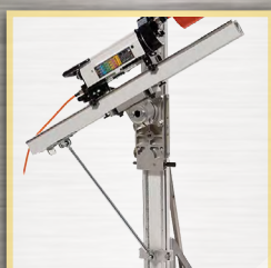
tête pivotante pour rail TS

Tél : +352 28 48 01 40 Email : contact@diatom.lu