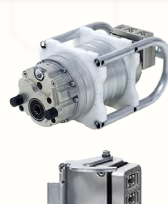
MOTEUR HF 15/ 18/ 22 kW