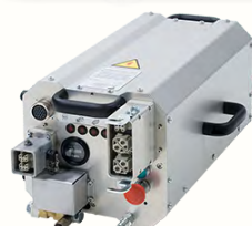
PENTPACK 427 HF