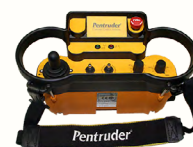
TÉLÉCOMMANDE SANS FILS HF