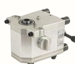
BOÎTE 4 VITESSES