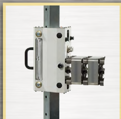
chariot CE1 + 2 écarteurs