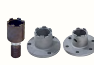
DÉCONEXION RAPIDE POUR FORÊT