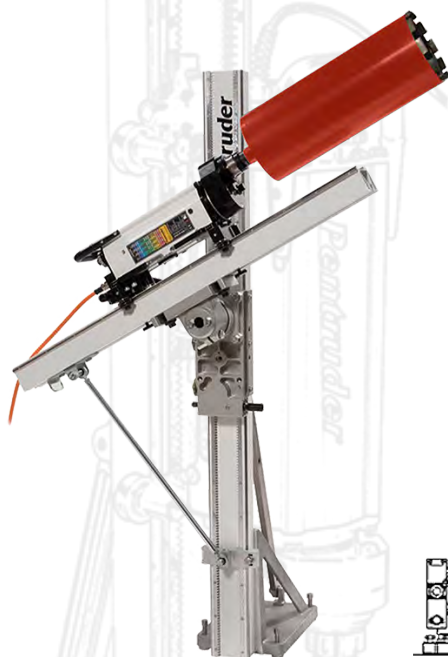
CEG-PDT1 sur rail TS et bâti de carottage