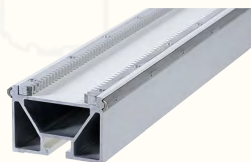
2x Rail TS 0,85/ 1,15/ 1,7/ 2/ 2,3/ 3,45 m