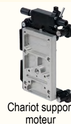
Chariot support moteur

Tél : +352 28 48 01 40 Email : contact@diatom.lu