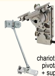
chariot à tête pivotante + support