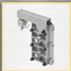
chariot descente automatique MD1