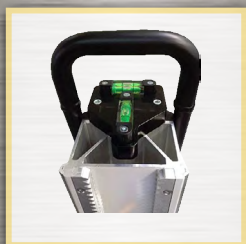
indicateur de niveau

DISTRIBUTEUR EXCLUSIF FRANCE FABRICATION EN SUÈDE