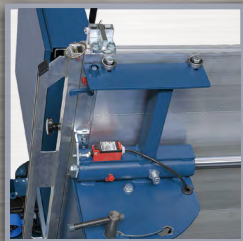
désactivation automatique du ruban en fin de course