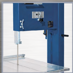
découpe précise et rapide