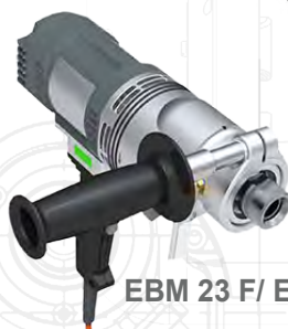
EBM 23 F / EBM 33 F