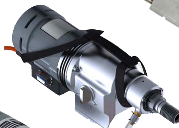
BBM 33L extra