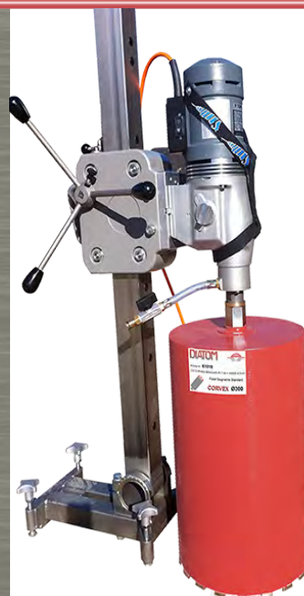
KF 400 FLEIKA + DX5