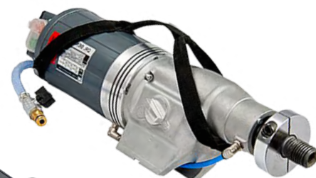
DX 5 L