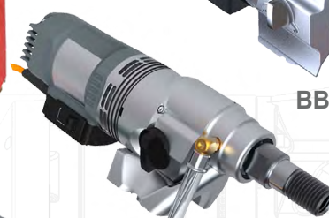
EBL 33 L