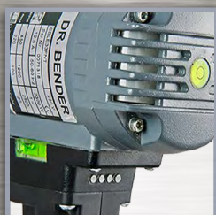
Bulles de niveau