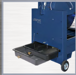
réservoir d'eau amovible