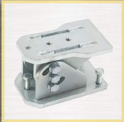
équerre réglable installation plan incliné