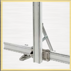
translation du bâti

DISTRIBUTEUR EXCLUSIF FRANCE FABRICATION EN SUÈDE