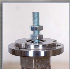
partie inférieure du BKF