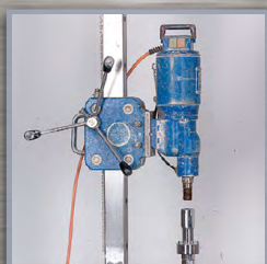
fixation du moteur sur système