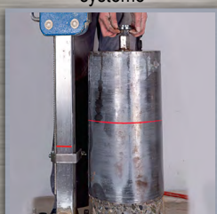
retrait de la carotte