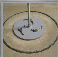
plaque de maintien BKF 450